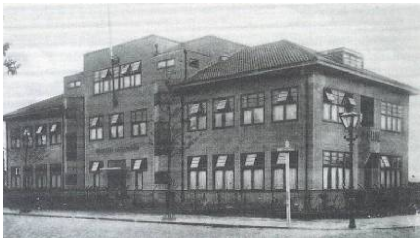
afb. 1. Het nieuwe gebouw; ansichtkaart, vermoedelijk jaren 30.