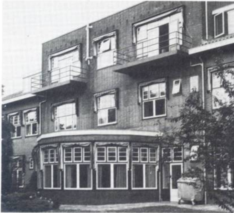
afb. 2 De erker aan de achterzijde Het dak kon met een kabel worden opgetakeld zodat de erker inder- daad geschikt was om het loofhut- tenfeest te vieren.

Zo lang de kinderen zich aan- pasten aan de religieuze normen van het huis waren er weinig moeilijkheden met de directie, weet Daniël nog. De oudere kinderen, van dertien tot acht- tien jaar, mochten 's avonds bij- voorbeeld het huis verlaten om schoolvriendjes te bezoeken. Bleven ze thuis dan was het meestal ook een gezellige boel. Spelletjes doen, muziek maken, studeren of wat helpen in het huis. Op vrijdagavond was het plezier maken afgelopen. Dan begon de sabbath en daar de